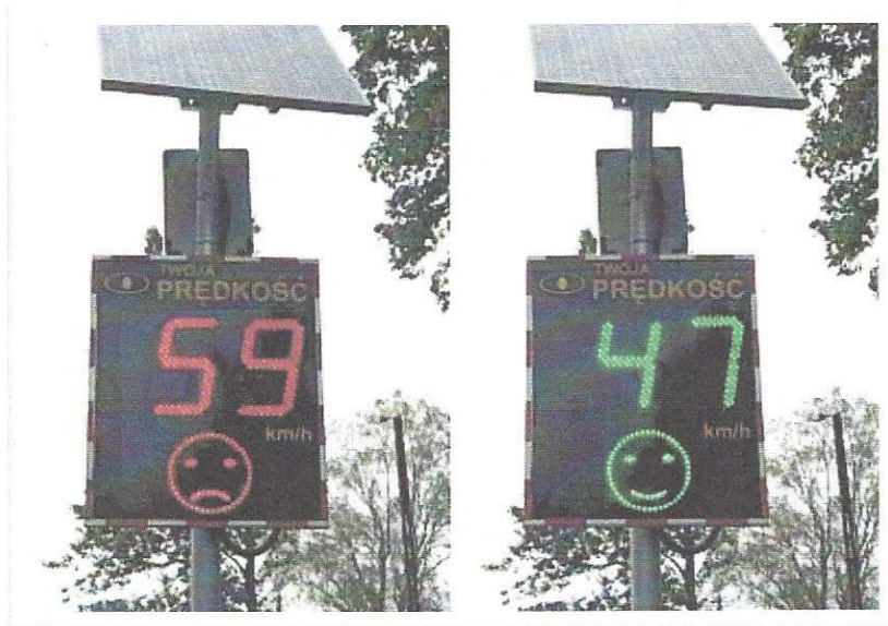
Radarowy wyświetlacz predkości MP-DP1+