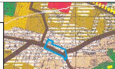
- obszar objęty miejscowym planem zagospodarowania przestrzennego