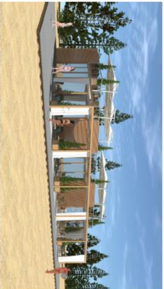
rysunek nr 1 - wersja drewniana + taras otwarty

Inspiracje dotyczące formy obiektu, oraz kolorystyki i doboru materiałów elewacji.