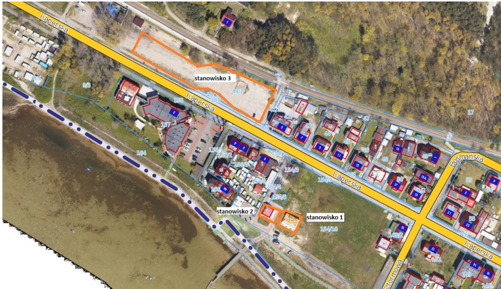
Mapa z zaznaczoną lokalizacją stanowisk nr 1, nr 2 i nr 3 Chalupy